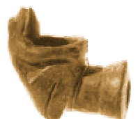
Pipa Town Creek