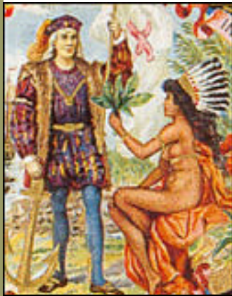
Mujer indígena ofreciendo tabaco a Colón

Sobre el siglo VI de nuestra era, vivían ya en construcciones masivas de barro con muchas habitaciones para varias familias, conocían el cultivo del frijol, del maíz y del tabaco, su alfarería les permitía fabricar cestos y pipas de arcilla muy dura que endurecían al sol.