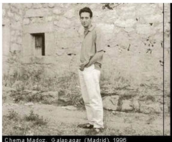
Chema Madoz. Galapagar (Madrid), 1998

En 1991 el Museo Nacional Centro de Arte Reina Sofía muestra la exposición "Cuatro direcciones: fotografía contemporánea española" que itinerará por varios países. Algunas fotografías de Madoz forman parte de esta exposición. Ese mismo año recibe el Premio Kodak. En 1993 recibe la Bolsa de Creación Artística de la Fundación Cultural Banesto.