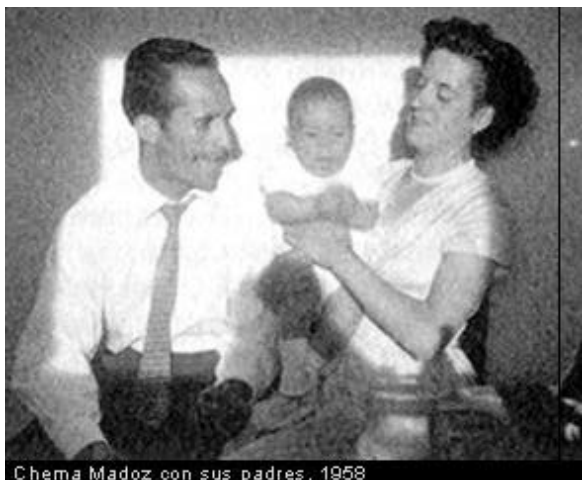
Chema Madoz con sus padres, 1958

José María Rodríguez Madoz nace en Madrid en 1958.