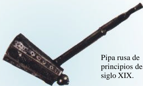
Pipa rusa de principios del siglo XIX.