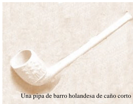
Una pipa de barro holandesa de caño corto

Se desmoldan las pipas y se llevan hasta la "desbastadora", una especie de pulidora, que quita las rebabas de las uniones e iguala los bordes de la cazoleta. Durante unos cuantos días se dejan secar a la sombra.