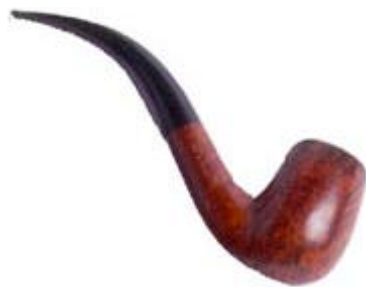
Las 3 Pipas

Foto de su pipa, cuya estimación de Cornete de St-Cyr, perito subastador ha sido de: 9.256 €(euros).